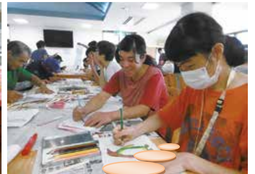
夏祭りに備えて灯籠作り！色とりどりでカラフルに仕上がりました！