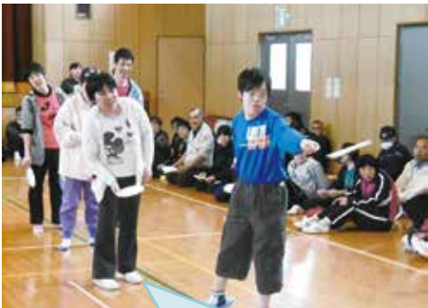
フライングディスク大会に向けて練習中！

育成園・けいわでは、毎月合同クラブ活動を行っております。他利用者の方々と交流を図ることと、利用者の皆さんの表現力を生かし、充実した余暇活動をしていただくことを目的に行っております。また、スポーツ大会等イベント行事が近くなった際は、練習を取り入れ、体を動かす機会にもなっております。活動を通して、利用者の皆さんには、楽しい余暇時間を過ごしていただいております。