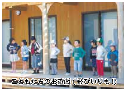
子どもたちのお遊戯(飛びいりも!)