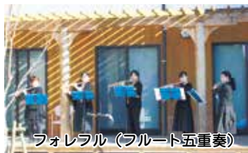
フォレフル(フルート五重奏)