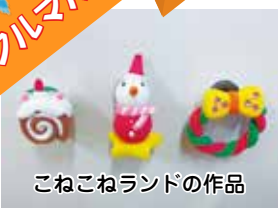
こねこねランドの作品