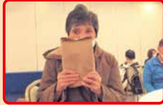
知覧育成園・けいわ・ぱれっと（合同）