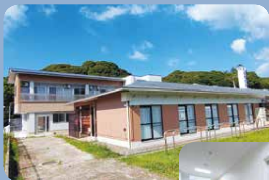
改修されたコスモス寮

昨年からの寮の増築、改修が始まり、12月には「さくら寮」が完成しました。新しいお風呂場や居室で快適な寮生活を送られています。現在は「コスモス寮」を改修中です。今年中には寮の改修が終わり、すべて1人部屋になる予定です。これから益々工事が進み、新たな「コスモス寮」「サツキ寮」の完成を皆さん心待ちにされています！