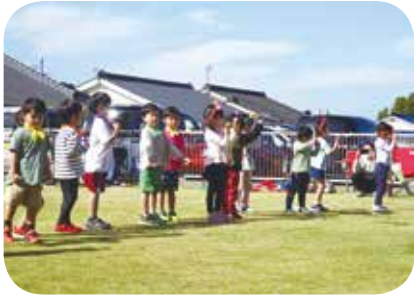
児童発達支援の子どもたちのダンス！