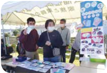
生活介護による販売