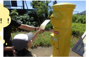
「幸せを届ける黄色いポスト」に投函！