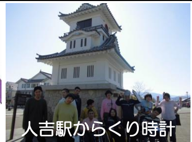
人吉駅からくり時計