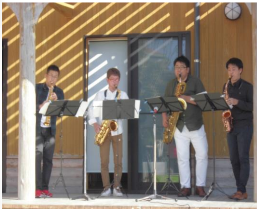
サクソフォンアンサンブル”る・トレフル”