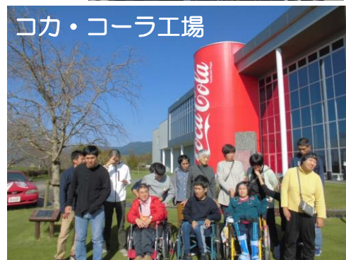
コカ・コーラ工場

11月1日・2日に熊本県人吉市に研修旅行に行っていました。普段なかなか経験できない工場見学などにも参加でき、みなさん興味津々でした。レトロな電車にも乗れて貴重な体験となりました。