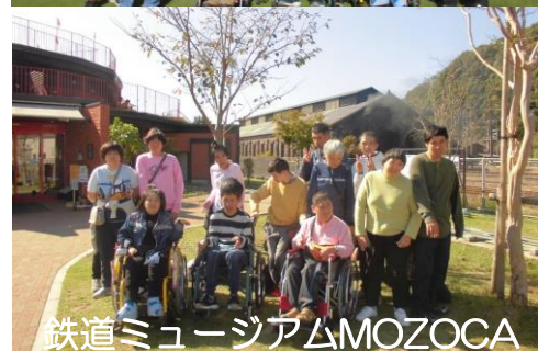
鉄道ミュージアムMOZOCA