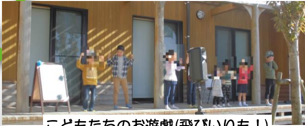
こどもたちのお遊戯(飛びいりも!)