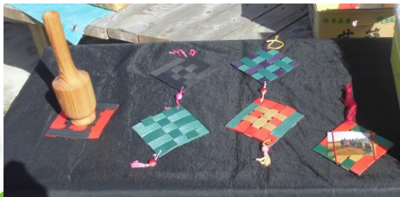
生活介護作品 (紙バンドのコースターや飾り)