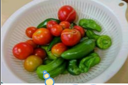
畑で採れた夏野菜

園芸の活動で苗を植えて育てた夏野菜を収穫し、クッキングの活動でピザを作りました。餃子の皮にケチャップを塗って、はさみで切った野菜とチーズを乗せて、トースターで焼いたら、一口ピザのできあがり！みんなで協力して作ったピザは最高でした！