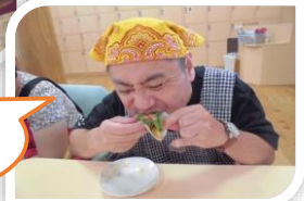
野菜とチーズがアツアツでおいしい!!