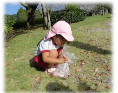
どんぐりたくさん拾ったよ