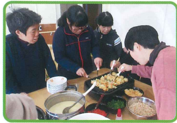
みんなでたこ焼き